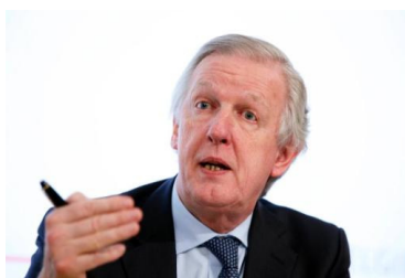
Minister van pensioenen, Daniel Bacquelaire

Voor carrières in het buitenland tellen de daar gepresteerde jaren eveneens mee, als ze werden gepresteerd in een land van de Europese Economische Ruimte, Zwitserland of een land waarmee België een verdrag over de sociale zekerheid heeft afgesloten.